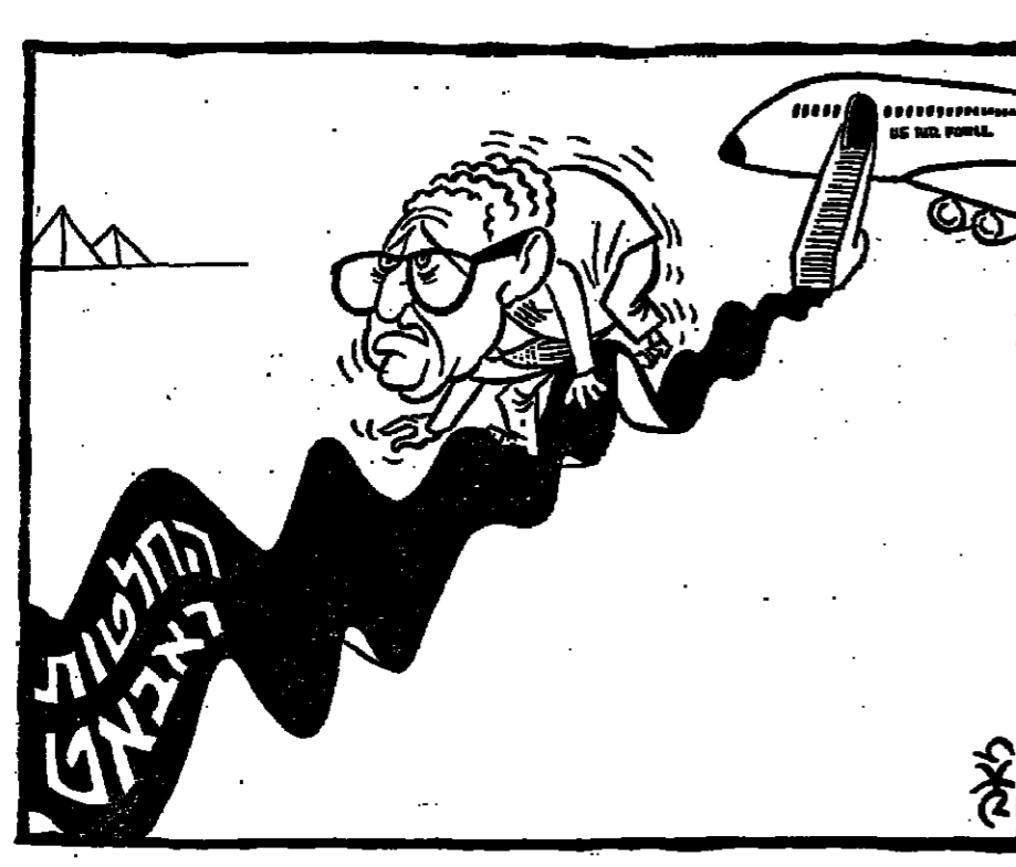
יצחק רבין בדיון ל"שפיגל"